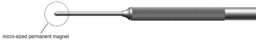
Fig. 1: intraocular magnet, not to scale

These product related processing instructions for critical* medical devices (MD) are exclusively valid for the above listed items by GEUDER AG. All medical devices that are provided in a non-sterile way must be reprocessed before each application.